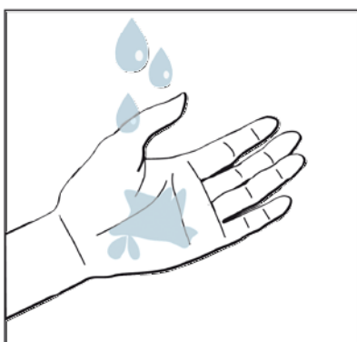
7. Genügend Handdesinfektions- mittel auf die Hand nehmen