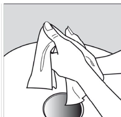
6. Se sécher les mains.