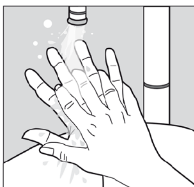
5. Bien se rincer énergiquement les mains.