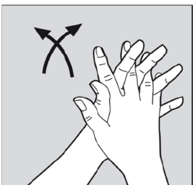
4. Bien se frotter énergiquement les mains.