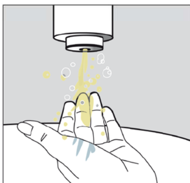
2. Bien se frotter énergiquement les mains.