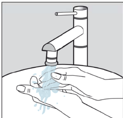
1. S'humecter les mains.