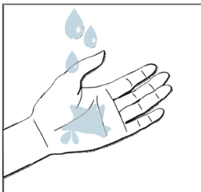
7. Uzeti dovoljno dezinfekcijskog sredstva na ruku